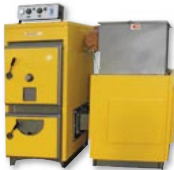
BIOPLEX HL MIX (17–1163 kW)