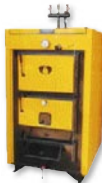
MULTIPEX CL (17–1163 kW)