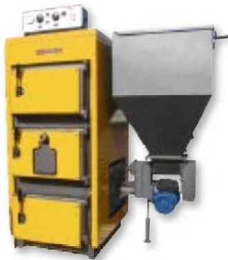
BIOPLEX HL (17–1163 kW)