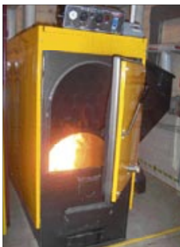
Kotłownia 128 kW – Dom Kultury Świt w Warszawie